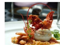
Gastronomia e Vinho