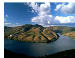
Touring Cultural e Paisagístico