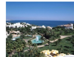
Resort's Integrados e T. Residencial