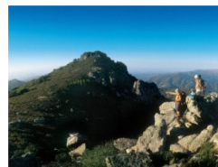
Turismo de Natureza