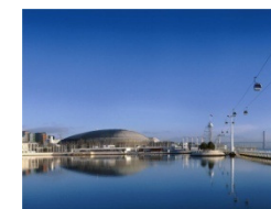
Turismo de Negócios