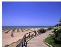
Sol e Mar